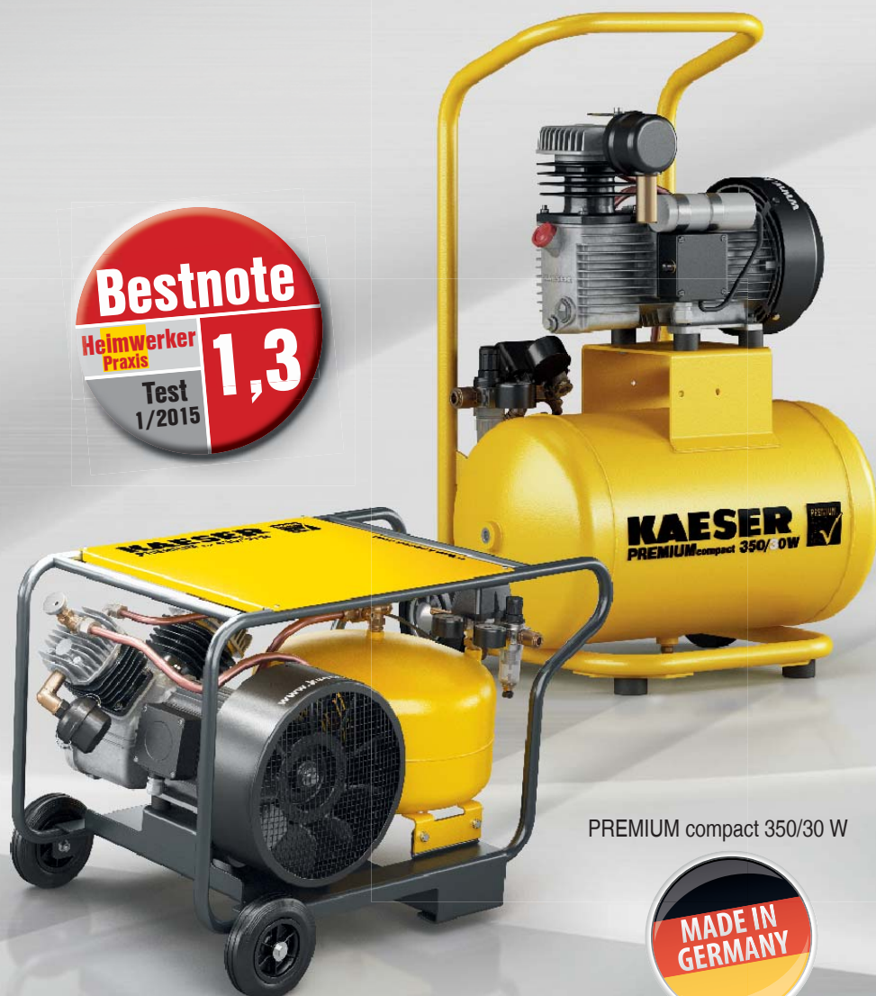
PREMIUM compact 350/30 W